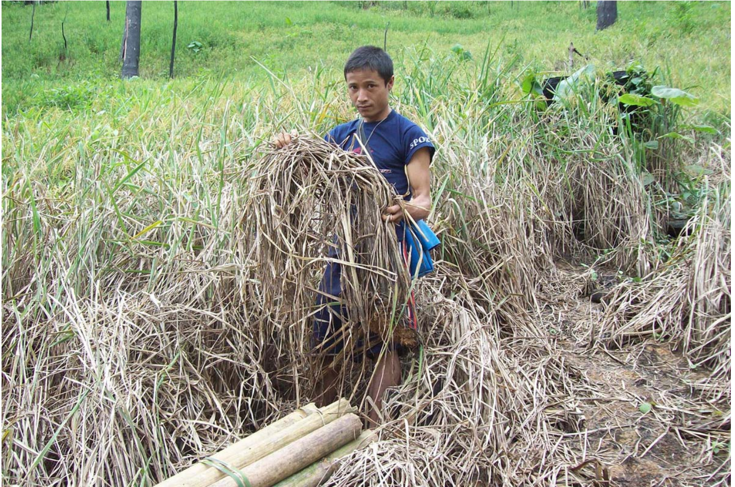
တံခါး-ကုမ္ပဏီ

ကွဲကလုာ် • လါနီလီ ၈သီ နီနီဝုဘာ် ၂၉, ၂၀၁၀