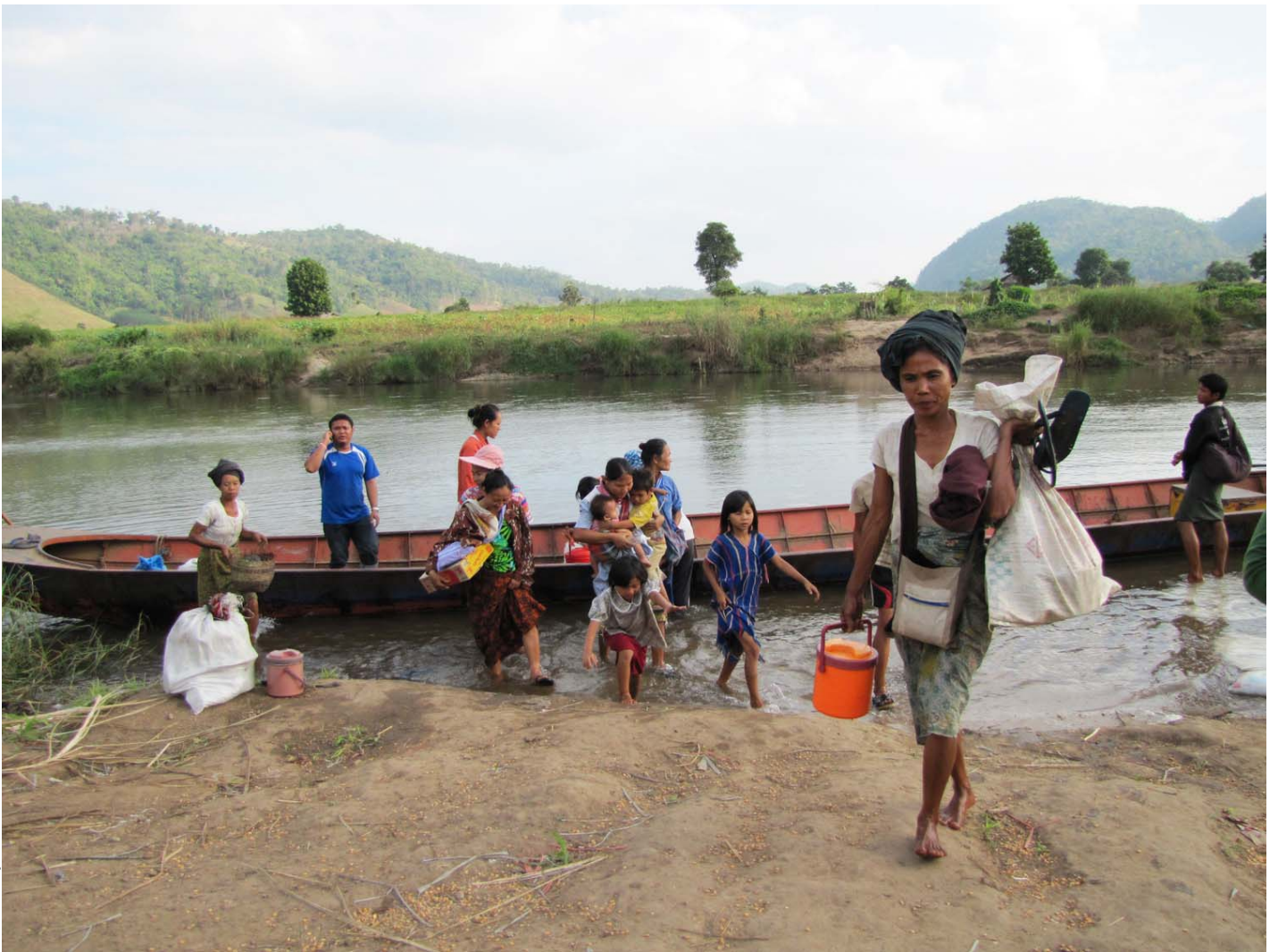
တၢ်ဂီၢ်-ကွေ့ကလွန်