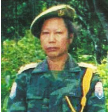
သုးခိၣ်ဒိၣ်ဖိစီၤစူထာၣ်

အိၣ်မုၢ်လဲၤခိၣ်ဖိအပူတၢ်လါအမၤဘၣ်ဒိ အသးအခိၣ်အါအကျါတခါမုၢ်ဖဲဒဲါ ဖဲအဖိခိၣ်သုးခိၣ်မိၤရွဲလီၤကွံာ်လါတၢ်ဒုး အဆါကတီၢ်န့ၣ်လီၤ. တၢ်လဲၤခိၣ်ဖိအပူ တခါစ့ၢ်ကီၢ်ဖဲအမါသံကွံာ်ခံအလီၢ်ခံ ဒီးအဲၣ်စ့ၢ်ကီၢ်အမုၢ်တၢ်ပျူတီၢ်ဒီးတၢ် ဆူးတၢ်ဆါအဖိခိၣ်ဖဲ ၁၉၉၇ နံၣ်အ လီၢ်ခံတၢ်ဟ့ၣ်လီၤအိၣ်မုၢ်လါကအိၣ်လါက သံၣ်တၢ်ပျူအပူတၢ်လါအသးသမုၢ်က တၢ်တစုန့ၣ်လီၤ.