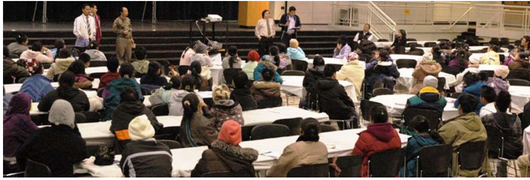
တော်ပျူစု

တော်ထံနီလိာ်အိနီသကံးတ ဘျူအံးမူခိနီဖိမိာ်လဲဘာ်ဆုနီဖဲဖဲသ့ညါ, ကွဲးဖိမိာ်ပာ်, ကွဲးစုးဒီးကမံးတံခိနီ နီဟဲထီနီကအိနီဝဲ ၃၅၀-၄၀၀ယာ် ယာ်ဒီးတော်ထံနီလိာ်ဆူညါတဘျူကမာ် လဲယနူအါရဲ ၈သီ, ၂၀၁၁နီနီနီ လီ။