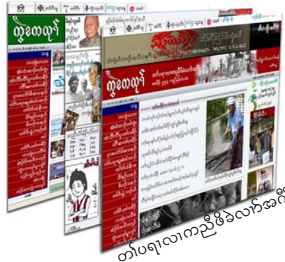
တၢ်ပရၢလၢကညီဖိခဲလၢ်အဂီၢ်

လၢတၢ်န့ၣ်အယီၤကီၢ်ပယီၤထံၣ်ဂီၢ်ကီၢ်သးတၢ်ဂ့ၢ်ကီၢ်အံၤကဆဲးအိၣ်ဒီးဝဲအဖမုၢ်ဒီးထံလီၢ် ကီၢ်ပူၤတၢ်ဖးတၢ်ယၤကဆဲးကဲထီၣ်အသးန့ၣ်လီၤ. အလီၢ်အိၣ်လၢသးပဒိၣ်, ဒံၣ်မိၣ်ခြံၣ်စံၣ်ကရၢ ခဲလၢ်ဒီးကလၢၣ်တဖၣ်ခိၣ်န့ၣ်ခဲလၢ်ကဘၣ်ဆုၣ်နီၤသကိးတၢ်ပီၣ်သကိးဃုက့ၤအဂ့ၢ်ကတၢ်လၢတၢ် ဃုၣ်လီၤကီၢ်ပယီၤထံၣ်ဂီၢ်ကီၢ်သးတၢ်ဂ့ၢ်ကီၢ်အဂီၢ်န့ၣ်လီၤ.