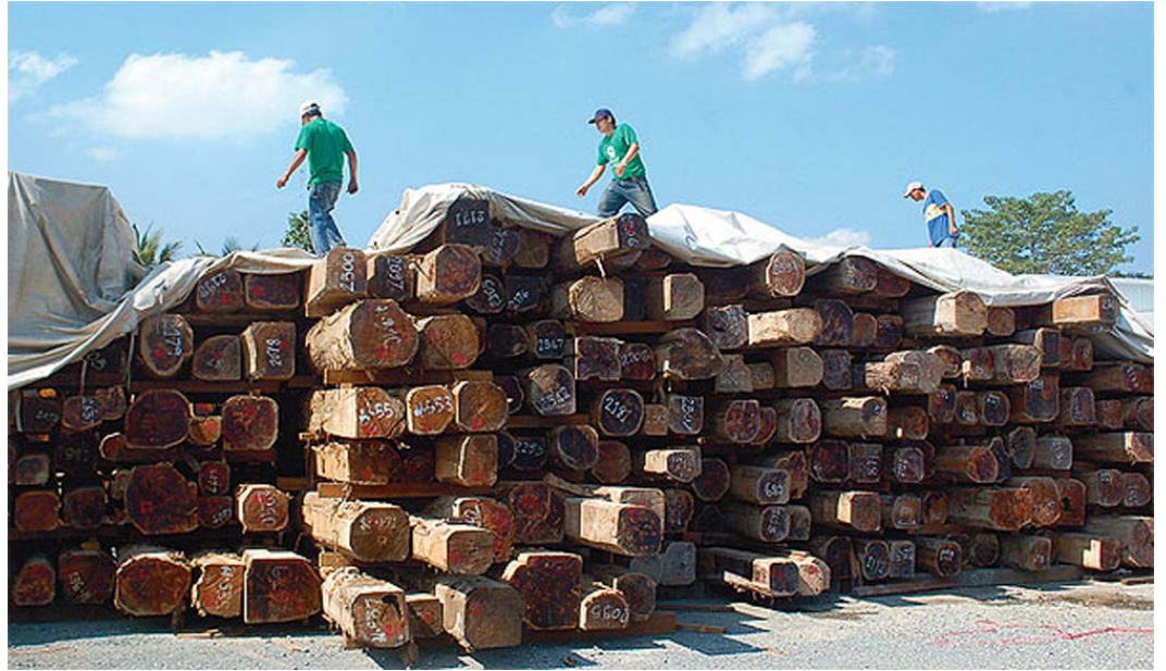
တၢ်ဖီၣ်န့ၣ်ဝဲန့ၣ်သ့ၣ်ပဟံၣ်အံၤဘၣ်တၢ်ဖီၣ်န့ၣ်အီၤလၢကီၢ်ကီၣ်တဲာ်ယီထံသ့ၣ်ညါတၢ်ဝဲကီၢ်လီၤဆီ, ခိသ့ဒီးစီၤပသ့ၣ်ပှးဝဲကီၢ်လၢအန့ၣ်လီၤယုဝဲန့ၣ်သ့ၣ် စးခံဖျါလၢအဘၣ်တၢ်ပအီၤလၢစူၣ်ကၢၣ်ဝဲကရၢက့ၣ်ပန့ၣ်.