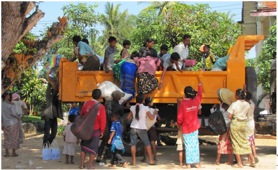
ဖဲကျီၣ်တံၢ်ပုဘၣ်မုဘၣ်ဒါဆုကဒါကုသဝီဖဲဖလူအခါ

ဒဲန့ၣ်အသးဒးယးခိၣ်စီ ကျီၣ်သးစံးစုၢ်ကီးဝဲလးကီးတရံးကီၢ် ဆၣ်တံၢ်လီၤအကတတီၤဒ်ခိၣ်ဘံၣ်အုၣ် ခိးခးဝဲဒ် နအဖ ခိၣ်ချုၣ်သးရၣ် ၂၃၁ ဖဲကွးကဝးသဝီလးဖဲလါနီၣ်ဝဲဘၣ် ၂၈ သီအနံၤလီၤ. အဝဲစံးဝဲလး နအဖ သးသံတီၢ် ၃၀ ဂးဒီး ဒ်ခိၣ်ဘံၣ်အုၣ် သးမးန့ၢ်ဝဲဒ်တံၢ်စုကဝဲ ၃၀ ခိၣ်န့ၣ် လီၤ.