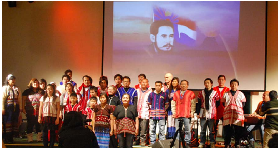
တော်ပျူစု

တော်ဟ့နီလဲကတီဝဲခိနီဖးမူး အယုသးခိနီခိနီစိစိလဲပျူအနီကစာ် ဒေဝဲကတီလီတော်လဲတံစိဒီးစံး ဘျူးစံးဖိနီဝဲကညီသဘျူကရါနီနီဝုလဲ အဟံပနီနီဒီးဟံလုာ်ဟံပျူသဲတံဖဲ တော်မာအယီနီနီလီ။ အဝဲစံးဝဲလဲသဲ ဆာထာ်ခဲအံးတော်မာ်လဲသဲဆာထာ်မာ်