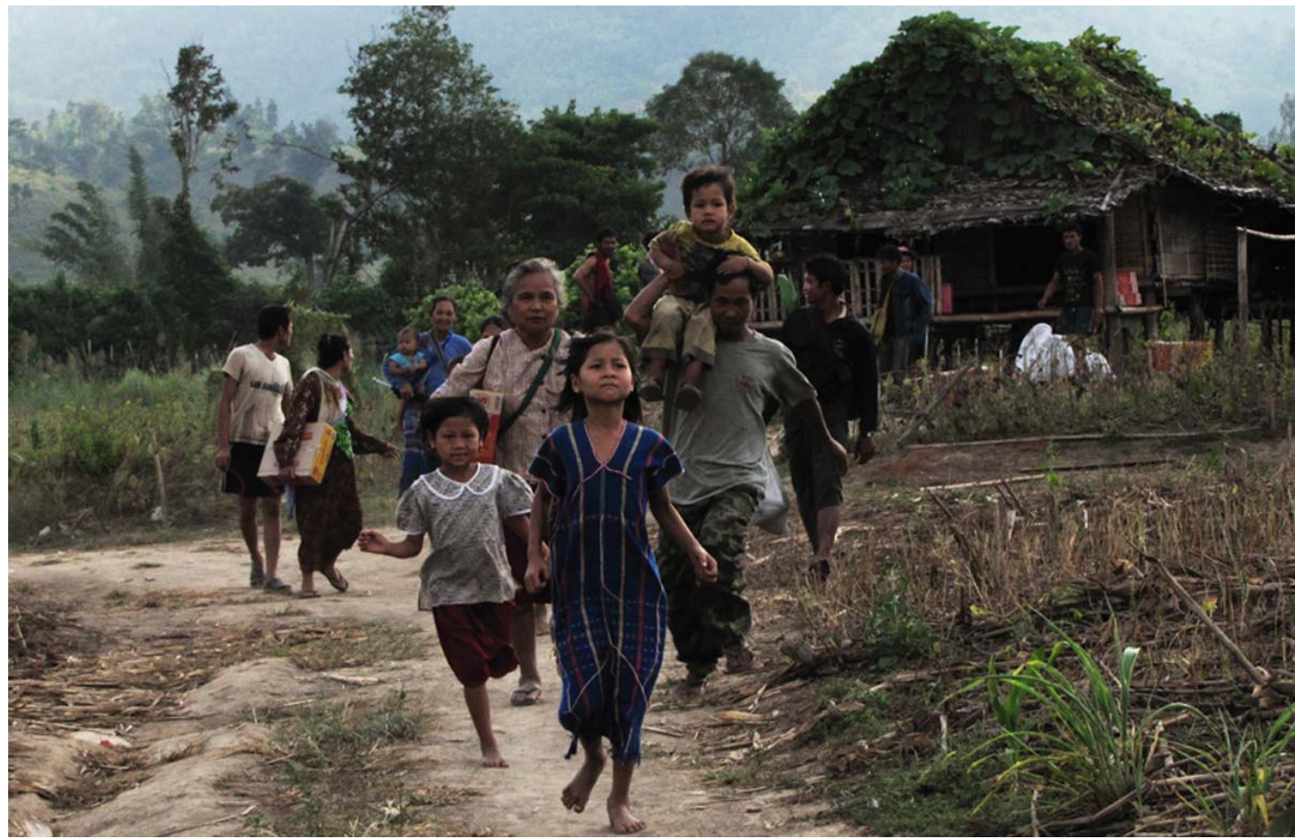
သဝီဖဲဖလူစံဉ်ထီဉ် နအဖ သုးတကဒုးအခါ. တကီ-ကွဲကလု

တကထီဉ် သးအံး သုးဖိ အံး ခး ကုအသုးရုဉ်ခိဉ် ဘဉ်ဆဉ် တ ဘဉ်ဘဉ်ဒီးဘဉ်ဒီးလါသဝီဖိတကသုး ဖိ ၃ကဝဲအနီဉ်ကစါမုထီဉ်ကွဲဝဲနုဉ် လီ. အသကီးတဖဉ်လုဒီးခးသံကဒါ ကုအီနုဉ်လီ.