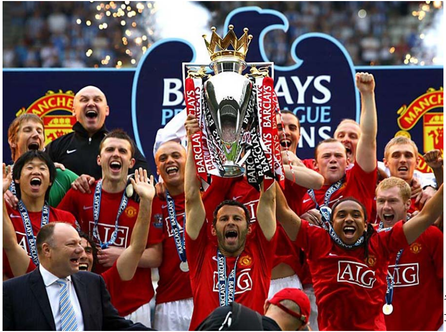
တၢ်ဂီၤမုအိၣ်ဝဲဒၣ်

အဲဝဲကမီၤပုၤဆါပုၤဝဲထံနီၤ ဖးတၢ် ဩးလူး ဝဲန့ၣ်(Bradley Manning)တၢ်ဟံထီၣ်တၢ်ကမၤအ ဝဲကမီၤပဒိၣ် လါ အဟ့ၣ်ခူသုၣ် ဝဲဒၣ် တၢ်ခူသုၣ်တဖၣ်အံၤဆူဝဲၣ်ကံၣ်လံးအ အိၣ် ၂၅၀,၀၀၀ တၢ်ဂ့ၢ်ဒီးအဲဝဲဘၣ်တၢ် လီၣ်ကျိးအီၤလါအဟ့ၣ်န့ၣ်တၢ်ဂ့ၢ်တၢ် ကျိးဒီးတၢ်စံၣ်ညီၣ်လီၤယီၣ် ၅၂ နံၣ် န့ၣ်လီၤ.