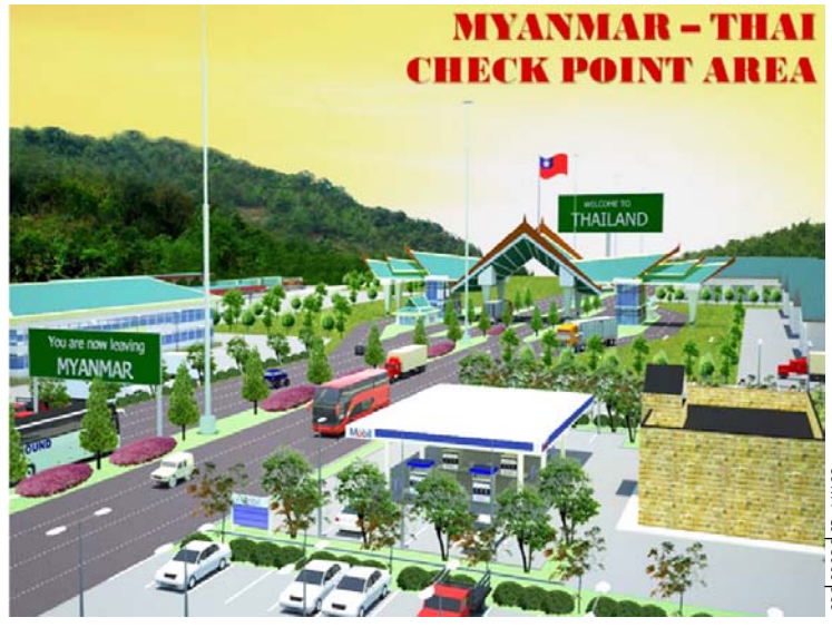
တၢ်ဂီၢ်-အံၣ်တလံၣ်ဝဲ

ထံကီၢ်လၢအကဟုကယာ်ဝဲဒၣ်ခိၣ်ဃၢၤန့ၣ် ဆၢဒီးပုၤကူၣ်ပညီတၢ်အိၣ်ဆူၣ်အိၣ်ချတဖျးအဂီၢ် တၢ်ဆိလီၤဝဲဒၣ်စးဖိကဟၣ်တၢ်မၤလီၤလၢအဖိမံလီၢ် အသးဒီးတၢ်သိၣ်တၢ်သီ(တၢ်မၤဘၣ်အကလံးကလီ တၢ်သိၣ်တၢ်သီ)လၢတၢ်ဟံၤပနီၣ်အီၤလၢစးဖိကဟၣ် တၢ်မၤလီၤအဂီၢ်န့ၣ်လီၤ။ ကီၢ်ကျိၣ်တဲာ်ဃုထၢဝဲတၢ် လီၤအံၤတၢ်တဖျးမုၢ်လၢသးပဒိၣ်အံၤတဖျးလၢကကန့ၣ်