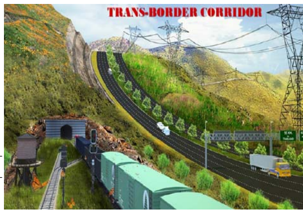
တံပအါ-အိတံလဲထီ

အယီလအနီတကအတံထံနု ဒဲ တံဂုထီပသီထီတံတီကုအံတံပုအီလက ကဲထီညီကဒဲဒဲဒဲဒဲဒဲဒဲဒဲဒဲဒဲဒဲဒဲဒဲ တံကတြီအီလုတုလုတီတသုဘာဆဲကဘာ မဲကုပနံအံလဲဒဲဒဲဒဲဒဲဒဲဒဲဒဲဒဲဒဲဒဲ သးတသုဘာနုလီ။ အါနုအနုတံကဘာ ယုလီထံဂုကီသဲတံဂုကီလအချတသု ဒဲဒဲဒဲဒဲဒဲဒဲဒဲဒဲဒဲဒဲဒဲဒဲဒဲဒဲဒဲဒဲဒဲ ကစီဒီး ပယီသုးအအိလဲလဲလဲဆု မု မုတခီတံလဲထီလဲထီလအကဘာ လုအါနုတံလဲထီလဲထီလအမလီမဲ ညီကလုတကုနုလီ။