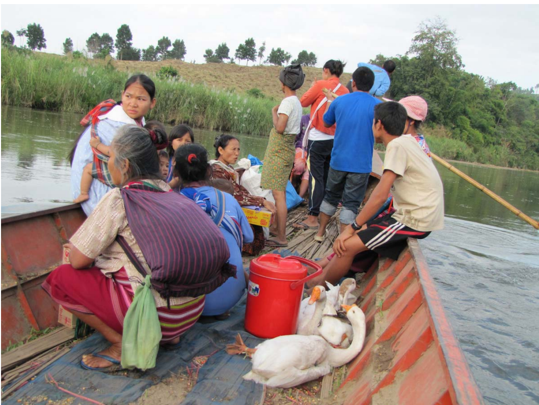
သဝီဖဲဖလူစံၣ်ထီၣ် နအဖ သးတံၢ်ဒးအခါ. တံၢ်ဂီၤ-ကွဲၤကလုာ်

ဖဲလါဒ်ခိၣ်ဘံၣ် ၈ သီမုာ်န့ၣ် ဒ်ခိၣ်ဘံၣ်အုၣ်ကျီၣ်ထုာ်လး နအဖ သးဒီးဒ်