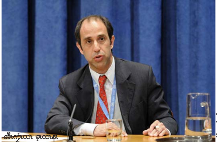
အီၤကွၢ်ယၤ ခုၤထၢန့ၣ်

ထံၣ်ဂၢ်ကီၢ်သးပုၤယိၣ်ဖိ ၁၅ ဂၤအံၤစး ထီၣ်ဒုၣ်တၢ်အိၣ်ဖဲလါအီးကထီၣ်ဘၣ် ၂၆ သီ ခိဖျိပဒိၣ်တၢ်မၤစ့ၢ်လီၤန့ၣ်အဝဲသ့ၣ်အတၢ်လီၤဘၣ် ယိၣ်အနီၣ်ဘၣ်, မ့မုၢ်ပုၤမၤကမၣ်ကီၢ်ဖိတခီပ ဒိၣ်မၤစ့ၢ်လီၤန့ၣ်ဝဲအလီၤဘၣ်ယိၣ်အနီၣ်န့ၣ်လီၤ.