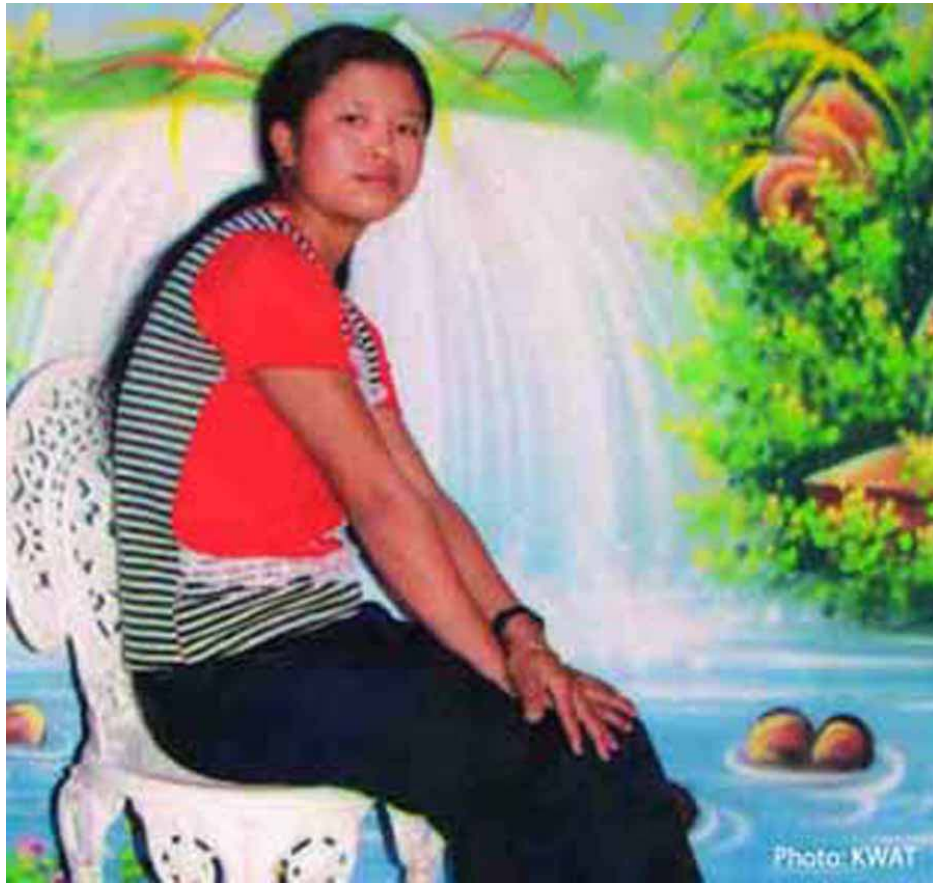
ကွဲးကလုၢ် . လါနီထီၣ် ၁၁၁၁ နီၣ်ဝုဘၢၣ် ၆, ၂၀၁၁

ထံလီၢ်ကီၢ်ပူၤတၢ်ဒုးတၢ်ယၤလၢအအိၣ်ထီၣ်ကဒါကွၢ်လၢကီၢ်ပယီၤကလံၤစိး ကခွၢ်ကီၢ်စဲၣ်ပူၤတကဟၤမၤဘၣ်ဒီးဘၣ်ထံးဝဲဒၣ်ကခွၢ်ကမုၢ်တဖၣ်လီၤဆိဒၣ်တၢ်ကခွၢ်ပိာ်မုၢ်တဖၣ်ဘၣ်တၢ်ခးပနီၣ်အိးဒီးဘၣ်တၢ်မူဆူၣ်အိၤလၢပယီၤသုးတဖၣ်တၢ်ကစီၣ်ဟးထီၣ်တၢ်ဝဲအါဘျီန့ၣ်လီၤ.