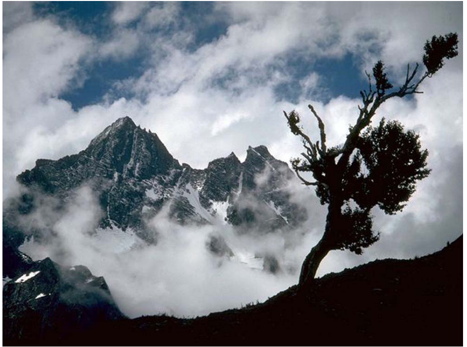
ဟ့မလုယၣ်ကစၢ်တူၢ်ရဲၣ်. တၢ်ဂီၤ-အ့ၢ်ထၢၣ်န့ၢ်

ထံကျိဖးဒိၣ်ဒ်အမ့ၢ် ကဲကွဲး, ဝဲခိၣ် (ကီၤလီၢ်ကျိ)ဒီးအ့ၢ်ရၣ်ဝဲတံၣ်(ပျါလီၢ်ကျိ)မ့ၢ် ထံကျိလါအစိးခံယွၤလါဝဲဒၣ်လါ ထံဘဲး ကစၢ် တူၢ် တဖၣ် လါတၢ် သ့ၣ်ညါ ဘၣ် လါ အမ့ၢ် တၢ် လီၢ်လါဟီၣ်ခိၣ် ချါ အဖီ ခိၣ် ဟ်ဖျါဟ် ကီၤ ယၢ် ဝဲဒၣ်ထံအါကတၢ်န့ၢ်လါ. ထံကျိဖးဒိၣ်သါ ဘီအံၤဖးမူဝဲဒၣ်ပျါလါအကကွၢ်တဖၣ်လါအ့ၢ် ရှါ အပူၤန့ၢ်လါ. ခိၣ်ဖျါထံလါသကတဖၣ်ယွၤလါ