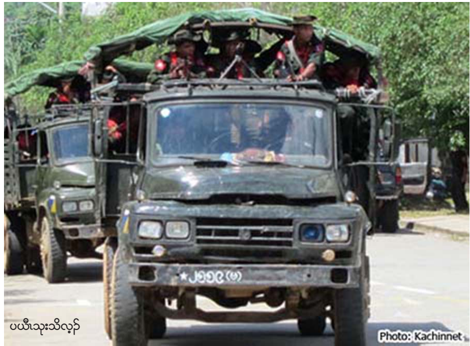
ပယီၤသုးသိလ့ၣ်

လၢတၢ်လီၢ်အံၤအပူၤကွဲးပိာ်မုၢ်သၢကဘၣ်တၢ်ကွၢ်ဖီၣ်ဆူၣ်အိၤဆူၣ်ပယီၤသုးကလၢတူၤခဲအံၤပယီၤသုးတပျီၤကွၢ်ဒီးဘၣ်. အဝဲသ့ၣ်ဘၣ်တၢ်မူဆူၣ်လၢကကဲထီၣ်ကုၢ်လၢအမၤမုၢ်ပယီၤသုးတဖၣ်အသးန့ၣ်လီၤ. အဝဲသ့ၣ်ဘၣ်တၢ်မူဆူၣ်စ့ၢ်ကီးလၢကဖိမုၢ်, အိၣ်ထံအဂ့ၢ်ပူၤဝဲတၢ်ဖိလၢအလုၢ်ထီၣ်လၢပယီၤသုးကလၢဖဲန့ၣ်ဖဲတယံၣ်ဒီးဘၣ်စံးဝဲလီၤ.