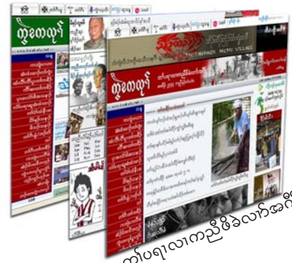
တၢ်ပရၢလၢကညီဖိခဲလၢဂ်အဂီၢ်

ဘီမ့ၢ်ထံၣ်ကီၢ်တဖၣ်ကဘၣ်ဆိၣ်သနးဝဲဒၣ်ကီၢ်ပယီၤပဒိၣ်လၢကပတုၣ်တၢ်မၤထီၣ်ဒါမူဆူၣ်ပိၣ်မုၢ်ဒီးကီၢ်ပယီၤပဒိၣ်အသိကဘၣ်ဟံးဂ့ၢ်ဝီအသုးလၢအမၤကမၣ်တၢ်ဒီးဟံးကဲတၢ်ဒုးတၢ်ယၢ်တၢ်သိၣ်တၢ်သီန့ၣ်လီၤ. ပဒိၣ်အသိမ့ၢ်တဟံးဂ့ၢ်ဝီဒီးသဖၢပိၣ်မုၢ်တဖၣ်ဘၣ်န့ၣ်ပဒိၣ်အံၤလီၤကဲဒုၣ်ဒ်ကလုာ်န့ၣ်စိမိၤစိရိၤသုးပဒိၣ်န့ၣ်လီၤ.