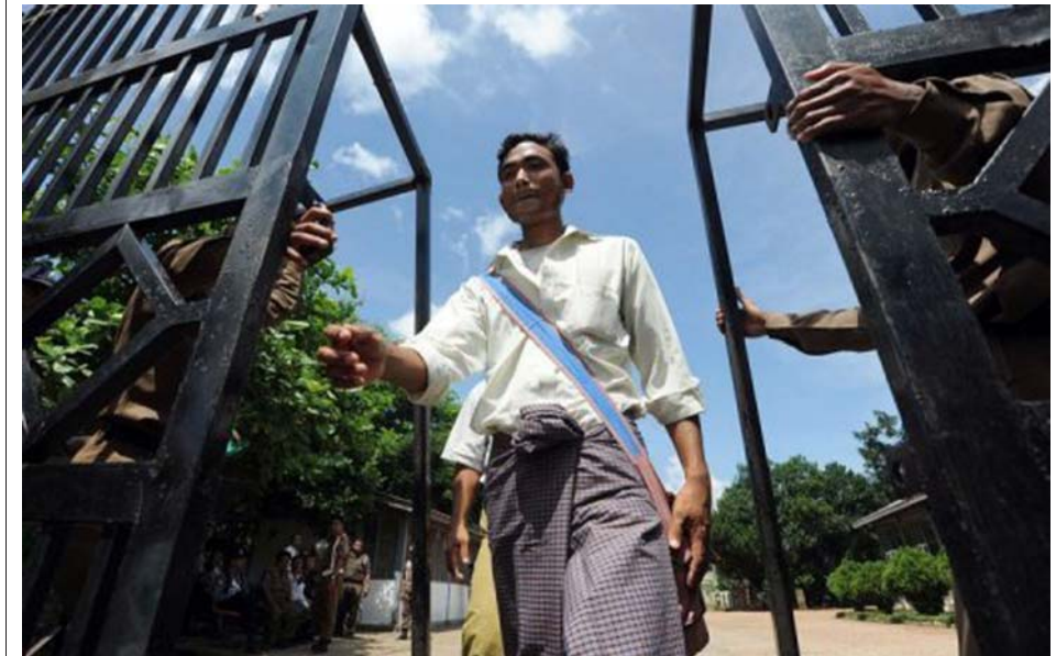
တၢ်ပျါကွံာ်ပုၤယိာ်ဖိဖဲအုၤစ့ၣ်ယိာ်ပုၤအခါ.

ကီၢ်ပယီၤအပူၤထံရူၢ်ကီၢ်သးပုၤယိာ်ဖိအိၣ်ဝဲဒၣ်တကထီၣ်ဒီးခံကထီၣ်အဘၣ်စၢၤန့ၣ်လီၤ.