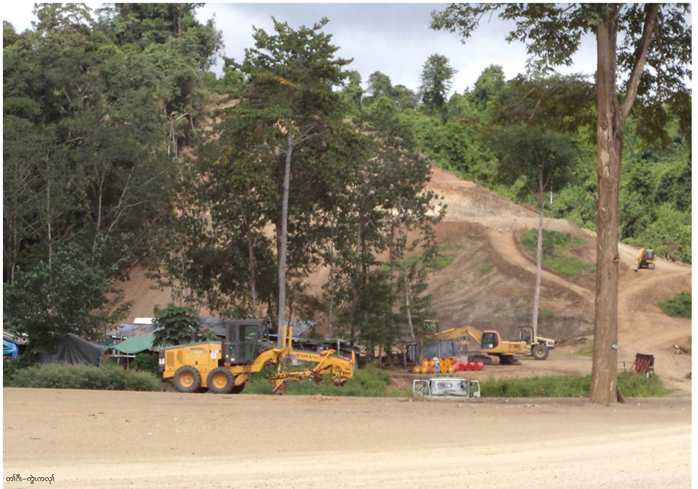
တၢ်ဂီၤ-ကွဲကလုန်

ဟံၣ်ဖျါအမံၤစံးဝဲလၢပယီၤသုးဆှၢအါထီၣ်ဖဲၣ်အ သုးရံၣ် ၆ ရံၣ်စးထီၣ်လါအိၤကထိဘၢၣ်ထီၣ် ၁၁ သီန့ၣ်လီၤ. ခွၢ်အဲၣ်ယုၣ်တၢ်ကစီၣ်တယၢ်ဝဲလၢခဲ ဆုကဘျးဟ ၂၃