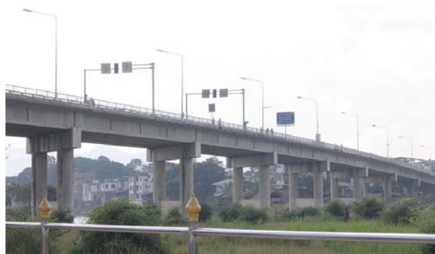
ကီၢ်ပယီၤ-ကီၢ်ကျီၣ်တဲၣ်ကီၢ်ဆါ မ့ၢ်ဝဲတံၣ်တီၤ. တၢ်ဂီၤ-အ့ၢ်ထၢၣ်န့ၢ်

တၢ်ကထီၣ်သးအံၤမ့ၢ်ဝဲဒၣ်ဖဲကညီဒီး ကလုာ်တၢ်ထုၣ်ဖျါသးမုၢ်ဒိၣ်သးရၣ် ၁၀၃, ဒ် ခဲၣ်ဘၣ်အ့ၢ် ၉၀၉ ဒီး ကီၢ် ပယီၤကွီၣ်ဖဲ အသးဒီး ပယီၤသးခိၣ်ချာသးရၣ် ၂၀၅ န့ၢ်လါ. တၢ်ဒုး ကထီၣ်ဝဲဒၣ်ဖဲမုၢ်န့ၢ် ၇ န့ၢ်ရံၣ်ဘျီန့ၢ်လါ.