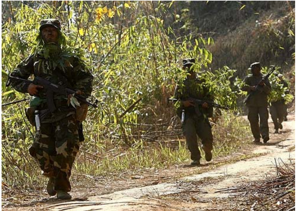
ယိကီၣ်စဲၣ်သုးမှ်-ကလံးထံး. တၢ်ဂီၤ-အ့ၣ်ထၢၣ်နဲး

တၢ်သံကွဲးမှ်တၢ်သ့ၣ်ထီၣ်ကွဲးယိ ကီၢ်စဲၣ်ကီၣ်ကးအပူၤတဲတၢ်ဟ လိာ်စဲ လၢတၢ် ထံၣ်လိာ်ကတီၤတၢ်အံၤကပၣ်ယုၣ်မှ်ဒီးယိ